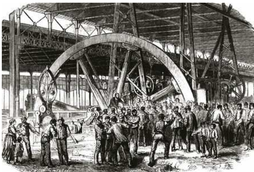
Le Creusot 1870