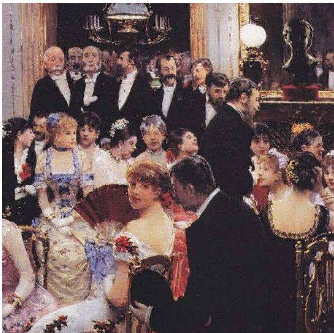
J. Béraud, vers 1880, huile sur toile, musée Carnavalet