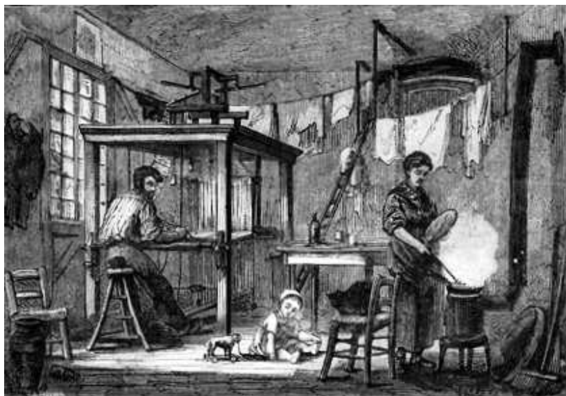
musée Gadagne (fonds Justin Godart), dessin de Gérardin.