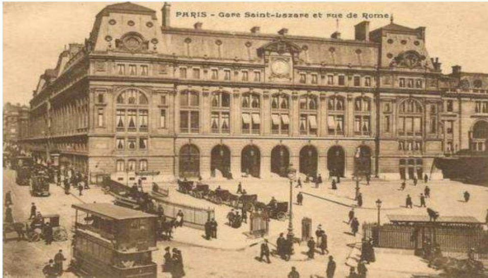
La gare Saint Lazare en 1890

« Partout où l'on place sur la lisière d'une capitale l'embarcadère* d'un chemin de fer, c'est la mort d'un faubourg et la naissance d'une ville. Il semble qu'autour de ces grands centres du mouvement des peuples, au roulement de ces puissantes machines, au souffle de ces monstrueux chevaux de la civilisation qui mangent du charbon et vomissent du feu, la terre pleine de germes tremble et s'ouvre pour englober les anciennes demeures des hommes et laisser sortir les nouvelles. »